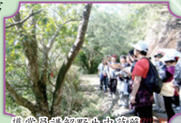
導賞員講解野生中草藥