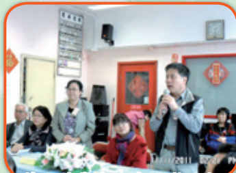
蒲公英學會代表致歡迎詞

澳門三巴門坊眾互助會暨三巴門坊會頤康中心交流團於2011年11月11日抵香港訪問。蒲公英學會、香港基層婦女聯會和中華老年創意智能會負責接待和作社區工作交流座談。