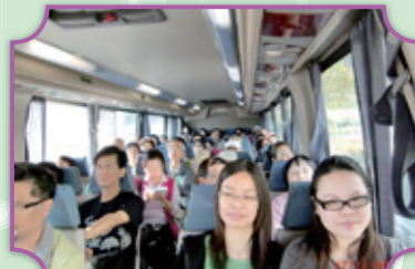
大隊乘坐旅遊車從太子出發

2011年11月27日蒲公英學會與國際中醫藥科技協會及香港中藥學會合辦一項名為「中草藥導賞 / 菊展 / 素宴一日遊」活動。是日天朗氣清，風和日麗，大隊乘坐旅遊車由太子出發，直達鶴藪。再繞鶴藪水塘而行，沿途由隨團之義務導賞員介紹五指毛桃、火炭母、茅梅、構樹……等等十餘種野生可食用之中草藥，眾人極感興趣，獲益不少。午餐設於雲泉仙館，品嚐美味素宴之餘，又順道參觀該館菊展，大家歡度一個愉快假日，盡興而歸。