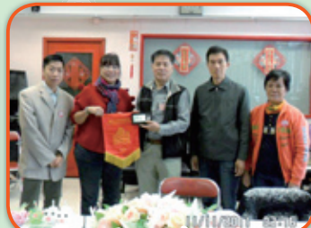
三巴門坊眾互助會致送紀念品