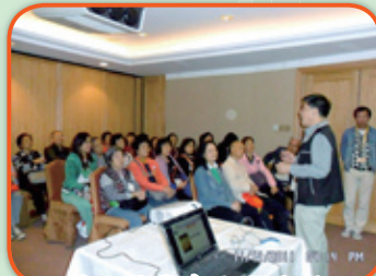
蒲公英學會為交流團 安排健康講課